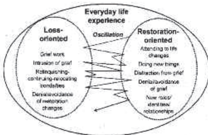
Figure 1 : Schématisation du DPM de Stroebe et Schut (1999, p. 213)

tous les jours prend trop de place, c'est alors le processus de deuil relié à l'être cher qui sera escamoté (Charles-Edwards, 2005).