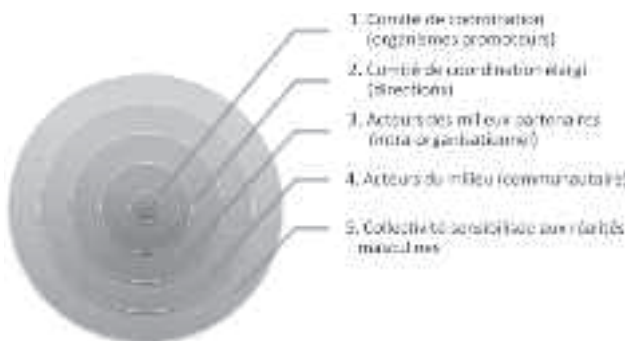
Figure 1. Modèle de concertation du projet Parle

Finalement, bien que la concertation soit à la mode actuellement, peu de récits de pratique en font état. Nous espérons avoir contribué, du moins en partie, à combler ce manque par la présentation du projet Parle. Ce projet est un bel exemple d'une communauté de pratique qui se réapproprie un pouvoir sur ses capacités d'intervenir tant dans une perspective de prévention que de promotion. Cette expérience d' empowerment est également un signe que le changement induit par les acteurs terrains est porteur de tout un potentiel de mobilisation et de sensibilisation à plus grande échelle.